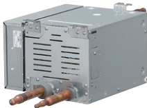
UTP-RX01AH / UTP-RX01BH / UTP-RX01CH