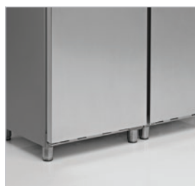
Puerta en inox.