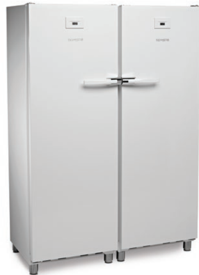
KITCF 350 PROW BLANCO