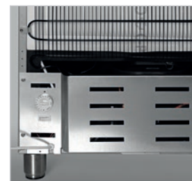
Pies regulable en altura.