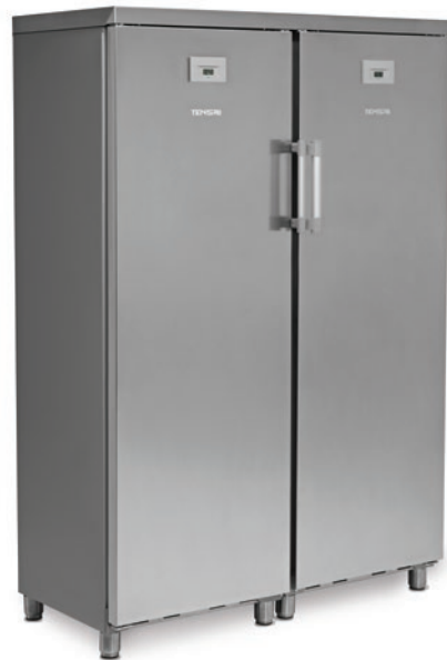
KITCF 350 PROSS INOX