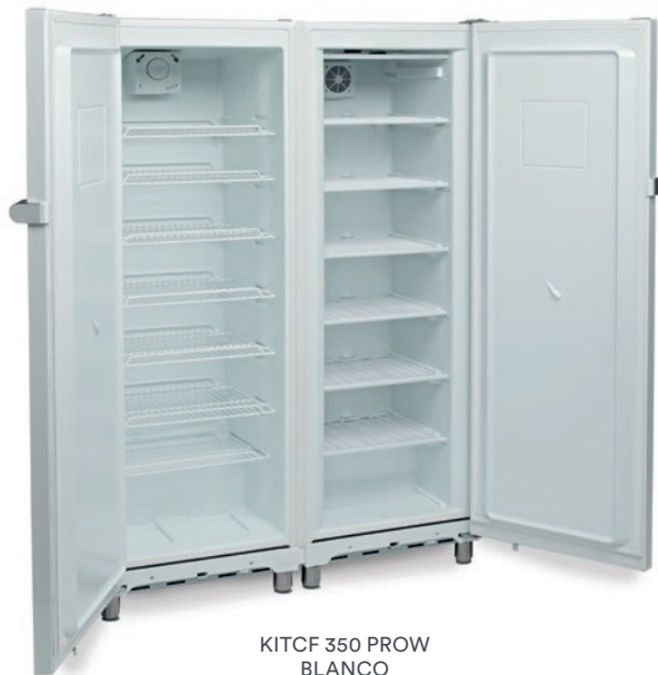
KITCF 350 PROW BLANCO